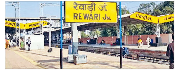
रेवाड़ी। रेलवे स्टेशन का फाइनल फोटो।