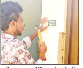
कनीना। आरएफ टैगिंग करते कर्मचारी।

नगर पालिका प्रशासन की ओर से शहर में स्वच्छता व्यवस्था को और अधिक सुदृढ़, पारदर्शी और प्रभावी बनाने की दिशा में एक महत्वपूर्ण पहल की गई है। डोर टू डोर कचरा संग्रहण प्रणाली के अंतर्गत आरएफ टैगिंग कार्य का विधिवत शुभारंभ कर दिया गया है। इस अभिनव योजना की शुरूआत वार्ड नंबर एक से की गई है, निकट भविष्य में चरणबद्ध तरीके से पूरे शहर के