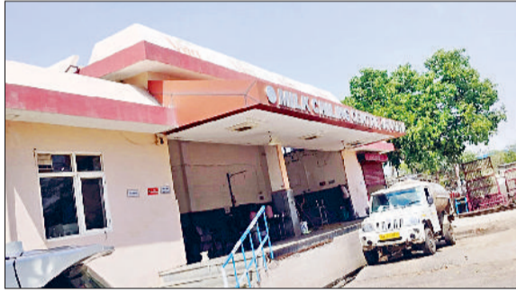
रेवाड़ी। जाटूसाना स्थित मिलक चिलिंग सेंटर।

मई माह से पशुओं का लीन पीरियड शुरू होना माना जाता है। भयंकर गर्मी के चलते पशुओं की दूध उत्पादन क्षमता में कमी आ जाती है। इस बार लीन पीरियड शुरू होने से पहले ही मिलक चिलिंग सेंटर में दूध की भारी कमी देखने को मिल रही है। आवक बढ़ाने के लिए दूध उत्पादकों को 5 प्रतिशत तक कमिशन दिया जा रहा है। गर्मी बढ़ने के साथ ही मिलक चिलिंग सेंटरों पर दूध की आवक में और कमी आने की आशंका बनी हुई है। दूध उत्पादक सहकारी समितियों को दूध ठंडा करने के बाद उसे रोहतक प्लांट में भेजने के लिए जिले में जाटूसाना और बावल में दो मिलक चिलिंग सेंटर बनाए हुए हैं। जाटूसाना मिलक चिलिंग सेंटर दशकों पुराना है। इस सेंटर के अधीन 52 सहकारी समितियां आती हैं, जो गांवों में दूध खरीदने