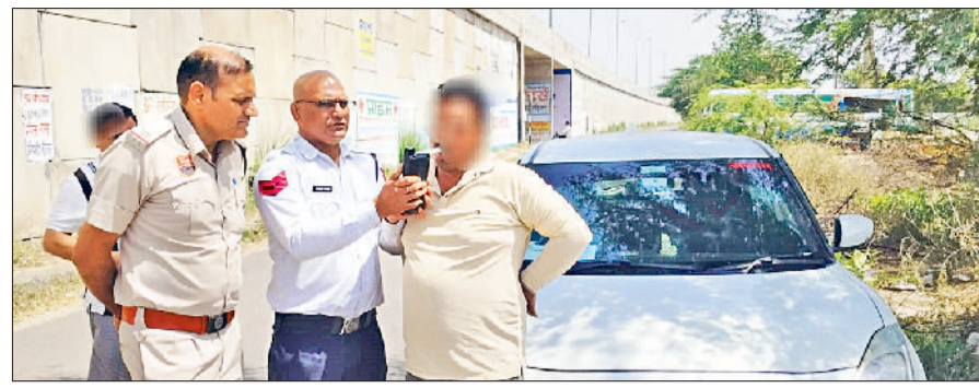
रेवाड़ी। अभियान के दौरान चेकिंग करते हुए ट्रैफिक पुलिस के जवान।