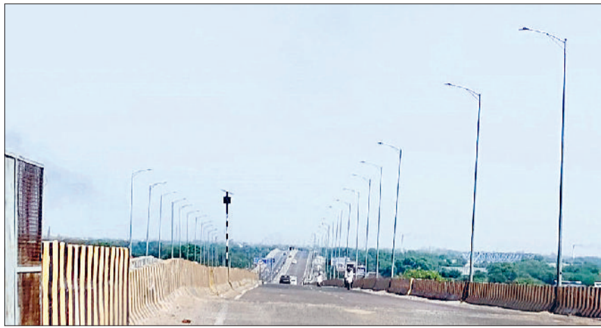
रेवाड़ी। बाइपास पर बंद पड़ी करोड़ों रुपये की लागत से लगाई गई लाइटें।

लोक निर्माण विभाग की ओर से जैसलमेर नेशनल हाइवे को झज्जर रोड से जोड़ने वाले आउटर बाइपास पर करोड़ों रुपये की लागत से लाइटें तो लगा दीं, परंतु बिजली कनेक्शन के अभाव में बंद पड़ी लाइटें खराब होने के कारण पर हैं। रात के समय रोड पर अंधेरा छाए रहने से हादसों की आशंका बनी रहती है। इस बाइपास के निर्माण के बाद नारनौल रोड से झज्जर रोड तक दोनों ओर सैकड़ों की संख्या में लाइटें लगवाईं थीं, ताकि आउटर बाइपास रात के समय जगमग होता रहे। लाइटें लगवाने के बाद विभाग की ओर से इन्हें नगर परिषद को सौंपे जाने की योजना थी, ताकि