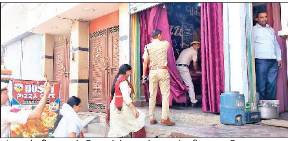
नांगल चौधरी। शहर के पिज्जा कैफे पर औचक छापेमारी करता पुलिस प्रशासन।

शहर की लगभग सभी गलियों में पिज्जा कैफे और होटल संचालित हैं। जिनमें अवैध गतिविधियों की रिपोर्ट मिलने पर पुलिस प्रशासन ने डीएसपी के नेतृत्व में औचक छापेमारी की। इस दौरान एक कैफे से दो से तीन छात्राएं मुंह छिपाकर भागी। इसके बाद पुलिस बैजनाथ चौधरी गर्ल्स कॉलेज की महिला प्राध्यापकों की उपस्थिति में तलाशी अभियान चलाया। इस दौरान संचालकों को पारदर्शिता पूर्वक कारोबार करने की हिदायत दी। जानकारी के मुताबिक बीते चार