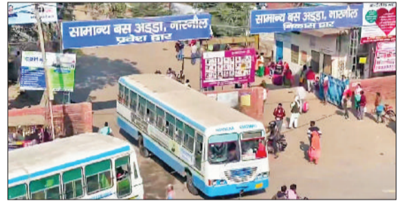
परेशानी का सामना करना पड़ रहा है।

ठाणी बाठोटा, मांटी, कांवी, भोजावास, अकबरपुर, नांगल कालिया के विद्यार्थियों ने बताया कि तापमान बढ़ते ही विभाग ने स्कूलों के टाइम टेबल में संशोधन कर दिया। सुबह आठ बजे से दोपहर दो बजे तक कक्षाएं लंगी, इसके लिए विद्यार्थियों को पौने आठ बजे तक स्कूल में पहुंचने की हिदायत है। विभागीय निर्देशानुसार विद्यार्थी सुबह 7:30 बजे निर्धारित बस स्टैंड पर पहुंच जाते हैं, लेकिन उन्होंने 8:45 बजे तक कोई लोकल बसें उपलब्ध नहीं होती। नांगल कालिया के बस अड्डे पर करीब 8:50 बजे लोकल